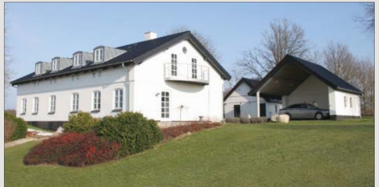
Det gamle, gennemrenoverede møllerhus ved kanten af Søgård Storsø, ligger højt hævet i landskabet. Den gamle mølle er længst forsvundet, men de gamle møllesten, som pynter rundt i haven, vidner om fordums virke.

Det flotte tag brydes arkitektonisk flot af en stribe zinkinddækkede karnapvinduer.