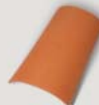
Rygningsssten (2,5 stk/m)