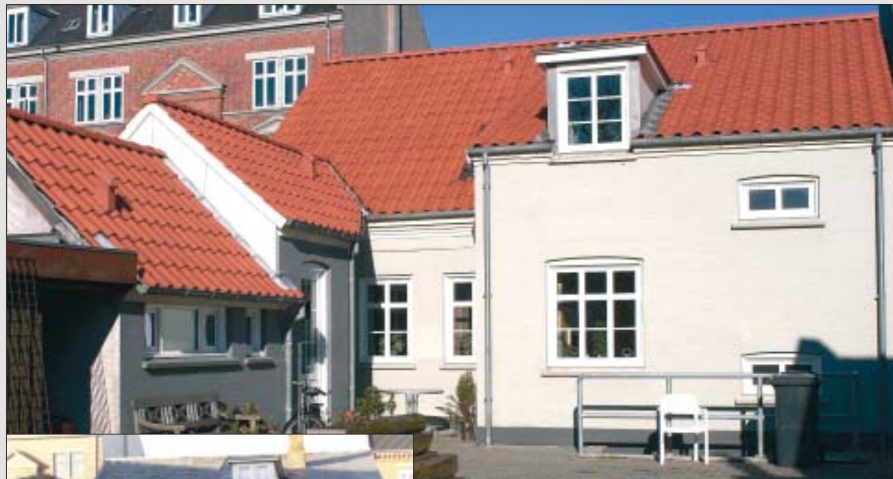
Efter: Nibra H 14 naturrød.

Farver, forme og overflader er mange, og der er helt sikkert et Nibra tag, der passer til et hvert hus.