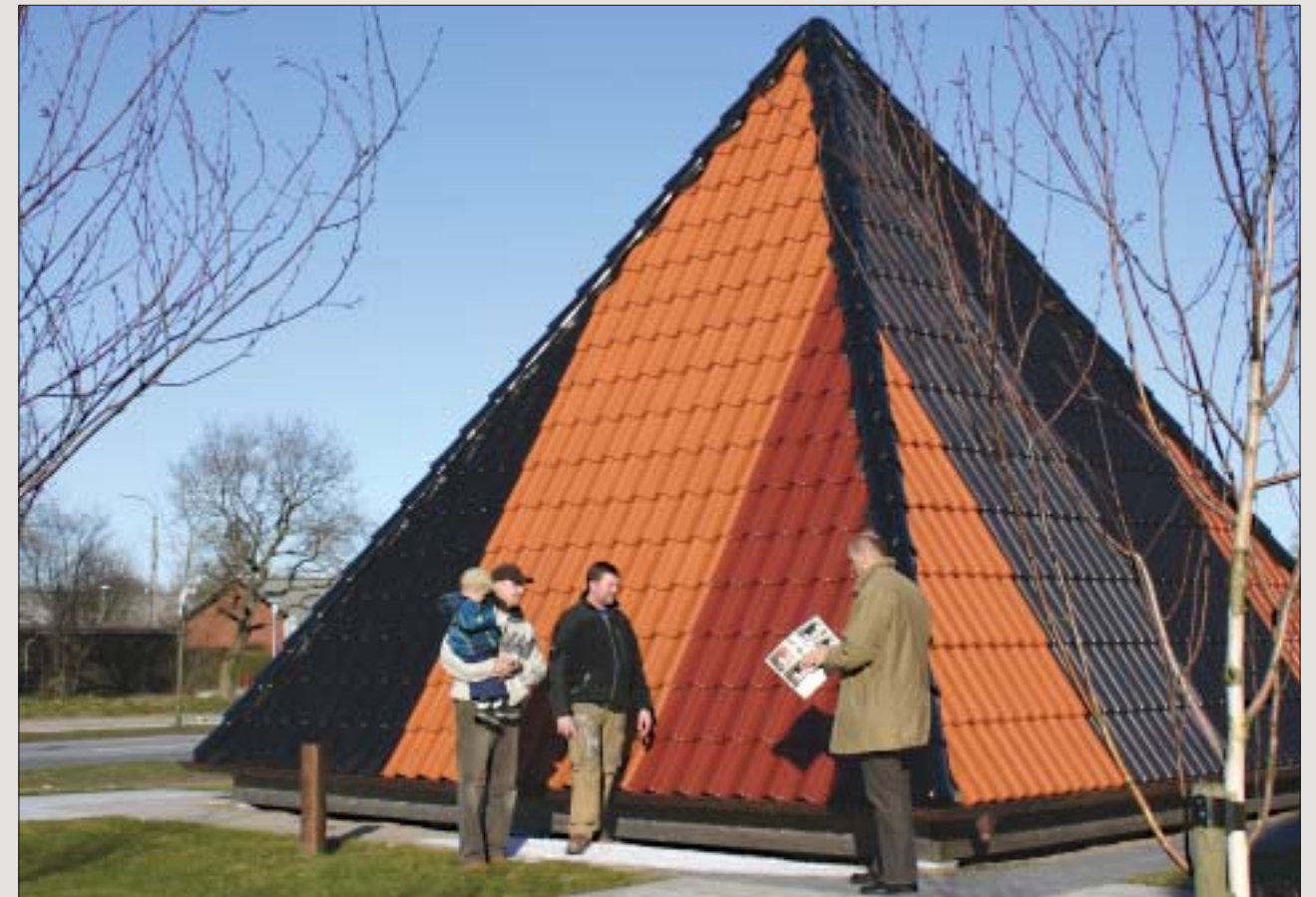
Et nyt tag skal holde i mange år. Det er derfor vigtigt, at du træffer det rigtige valg - første gang.

Alle disse punkter er væsentlige at overveje, før du vælger tagsten. Langt fra alle tagsten opfylder disse krav - det gør Nibra tagsten. På alle Nibra tagsten er farver og overflader brændt på teglet - modsat betontagsten og eternitplader, hvorpå farven er malet. Det betyder, at Nibra teglstenene er væsentligt stærkere, og de mister ikke farven af solens kraftige UV stråler. Fladerne på Nibra tagsten er meget glatte og har markedets absolut laveste fugtoptagelse. Herved minimeres væksten af alger og problemer med frostskafer elimineres. Under selve brændingen udsættes hver enkelt tagsten for ca. 1.150° C. Inden stenene når så langt, er de blevet udsat for et pres på mellem 200 og 450 tons og har været en tur i ovnen, hvor fugtindholdet er blevet minimeret. Denne fremstillingsproces sikrer markedets laveste fugtoptagelse på max 3 % på de oplagte sten og en brudstyrke på over 250 % over det krævede.