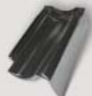
Vindskedest (model Holland)