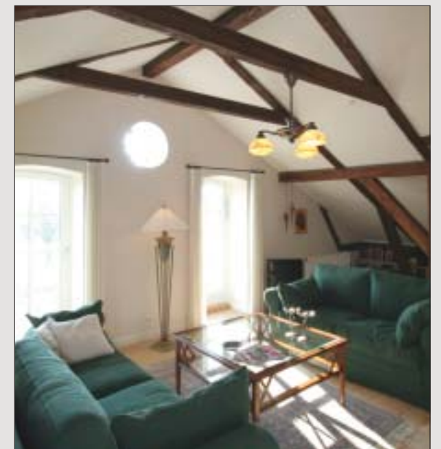
Det gamle kornloft indeholder i dag en hyggelig stue med direkte adgang til en lille terrasse, hvorfra der er god udsigt over skov og marker. I stuen har man blotlagt de smukke gamle bjælker, der står som dekorative skulpturer i rummet.

En nyskabelse er husets dørkarme, som er specielt designet til huset. De er forsynet med fræsede riller, som giver dem langt mere karakter end de oprindelige. En