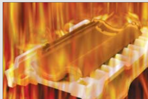
Nibra tagsten fremstilles med en unik kombination af lerpres og brænding ved ekstremt høje temperaturer - det sikrer markedets laveste fugtoptagelse på kun 3 % samt en brudstyrke på 250 % over det krævede.

Selve brændingen tager 8-10 timer og sker ved ekstremt høje temperaturer - en produktionsform, der i sidste ende giver en brudstyrke på 250 % over kravene og en maksimal fugtoptagelse på 3 %. Det er din sikkerhed for et tag, der modstår fugt og frostspringninger, og som holder vejr og vind sikkert ude.