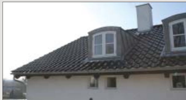
De små vinduer lige under taget, flugter gulvet på første sal og bidrager både ude og inde til billedet af et spændende og på mange måder utraditionelt hus.

Murværket er hvidmalet, det samme gælder de nye sprossevinduer, der selvfølgelig tager udgangspunkt i de