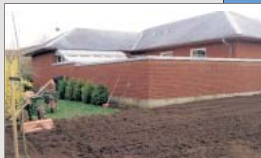
Før: Sort skiffertag.