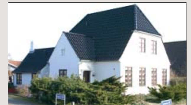
Farve og form på det nye tag skal matche husets øvrige materialer og stil, så det færdige resultat er harmonisk og fremstår som en helhed.

Sidst men ikke mindst skal selve konstruktionen, som skal bære tagstenene kontrolleres - vi anbefaler, at en professionel fagmand benyttes hertil. Det er ofte sådan, at det nye tag kan pålægges uden yderligere forstærkninger, men spærene skal i nogle tilfælde forstærkes - det gælder især, hvis det er et meget let tag som eternit o.l., der skal udskiftes.