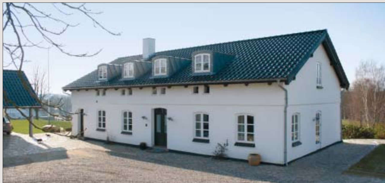
Materialerne klæder hinanden. Husets hvide mure, tagkonstruktionens sortglaserede sten og de rustikke grå zinkinddækninger omkring vinduerne danner tilsammen en moderne og gennemtænkt helhed.