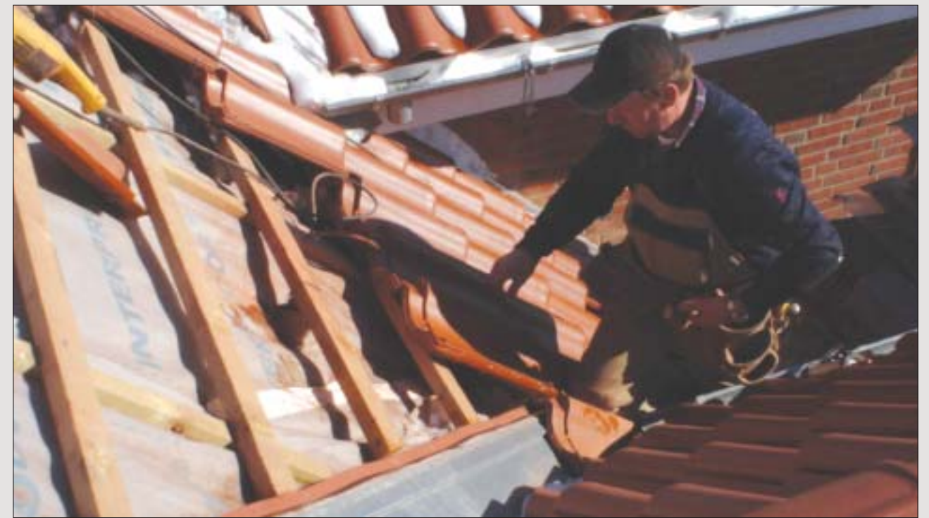
Tagkonstruktionen skal altid tjekkes, inden et nyt tag oplægges. Der kan være behov for forstærkninger, hvis det er et forholdsvis let tag, der udskiftes.