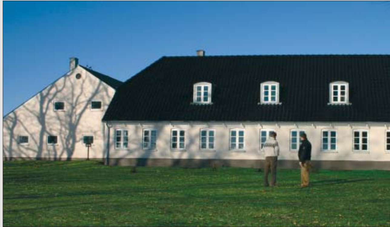
Nibra tagsten - hvis du ikke lægger hvad som helst på dit tag.

Når du først har besluttet dig for at lægge nyt tag, er der mange valg at træffe. Disse valg er ikke kun af synsmæssig og kunstnerisk karakter, de er i ligeså høj grad af funktionel karakter. Det er vigtigt, at du stiller dig selv spørgsmålet "hvilke krav har vi til vores tag?". Med udgangspunkt i dette spørgsmål skal du træffe dit valg - et valg, der følger dig og dit hus de næste mange år, og derfor skal være rigtigt første gang.