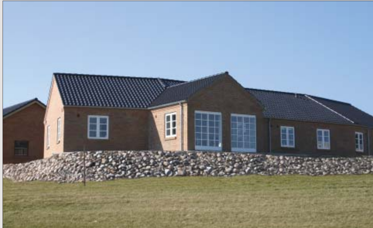
Arbejdet og udgiften til pålægning af tag er det samme - uanset valg af tagsten. Tænk derfor godt over, hvilke tagsten du vælger - og hvor det er værd at betale lidt ekstra.

Når man bygger nyt hus, er der mange valg at gøre og mange beslutninger at træffe. Det gælder også taget - og valg af tagsten. Ved et nybyggeri har man muligheden for selv at tegne og dimensionere taget, et perfekt udgangspunkt. Dog skal man altid undersøge, om der i det pågældende område er restriktioner om hvilke farver, der må bruges, og hvor højt et glanstal der er godkendt af kommunen. Vi hjælper naturligvis med at opfylde disse krav og restriktioner - bl.a. via de målinger vi har på vores tagsten fra Teknologisk Institut.