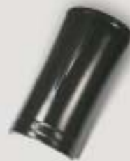
Rygningsssten (2,5 stk/m)