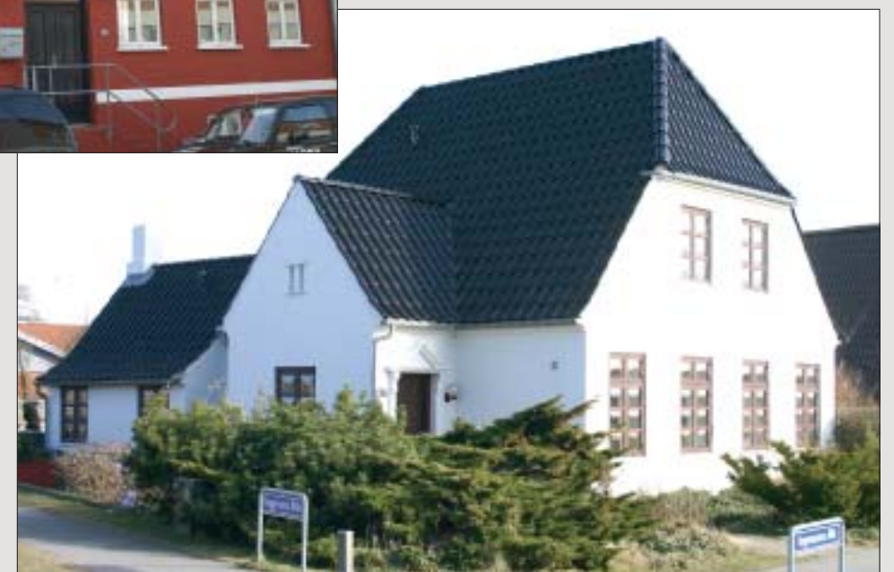
Sortglaseret Nibra H 10 lagt på et gennemrenoveret byhus.