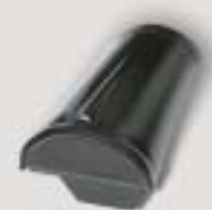
Rygningsssten start til vindskede