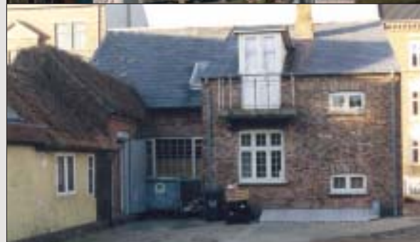
Før: Blandet tagmateriale.