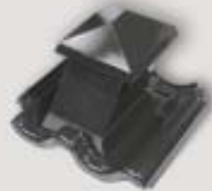
PVC taghætte 15x15 cm

Alle former for tilbehør kan ses i vores håndbog - heraf fremgår også alle tekniske detaljer og oplysninger.