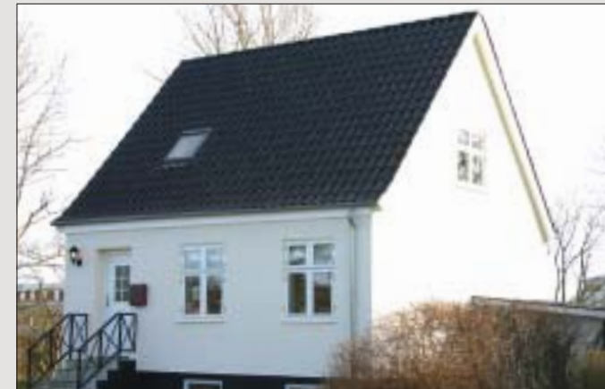
Tag: Sort edelengoberet H 14 som passer naturligt til huset.

Fire flotte renoveringer, der med Nibra tagsten på taget fremstår harmoniske med hver sin stil og hvert sit udtryk.