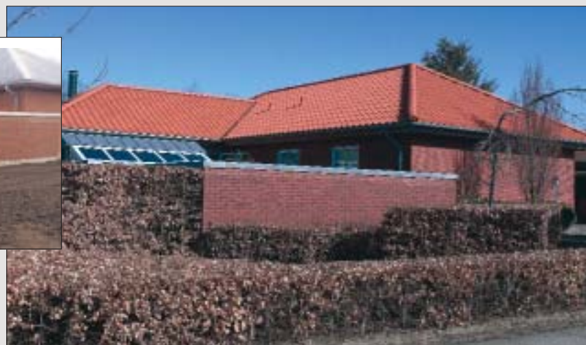
Efter: Nibra H 10 naturrød.

Fire flotte renoveringer, der med Nibra tagsten på taget fremstår harmoniske med hver sin stil og hvert sit udtryk.