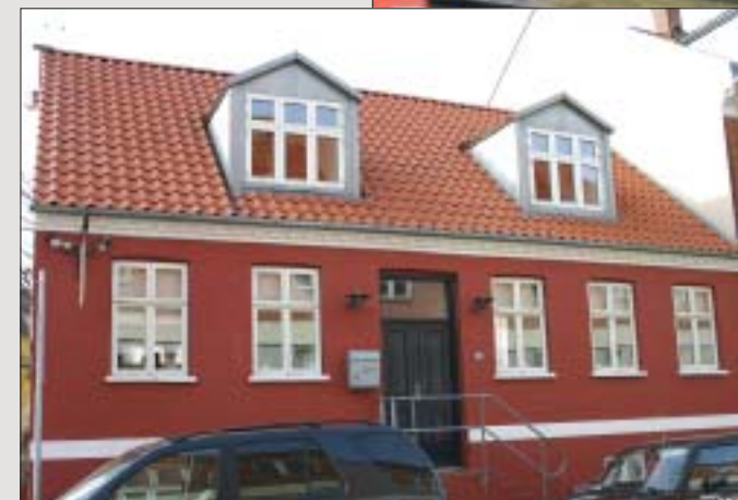
Ældre byhus gennemgribende renoveret med nænsom hånd. Til taget er valgt Nibra H 14 natur.