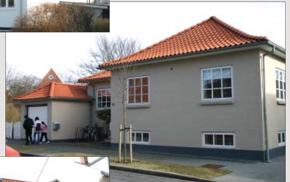
Bungalow renoveret med Nibra H 14 natur med fine detaljer.